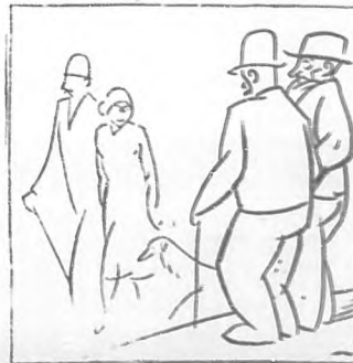
—Din que e millonaria. —Pois mira ti o que son as cruas: xa non me parece fea.