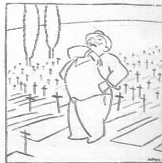
—Queridos compatriotas: Viva la libertad, la fraternidad y la igualdad...

¿Hemos hecho una semblanza del insigne humorista? No. Sólo hemos querido apuntar algunos de sus rasgos más salientes. La figura espiritual de Castelao no cabe en el espacio apretado de una crónica.