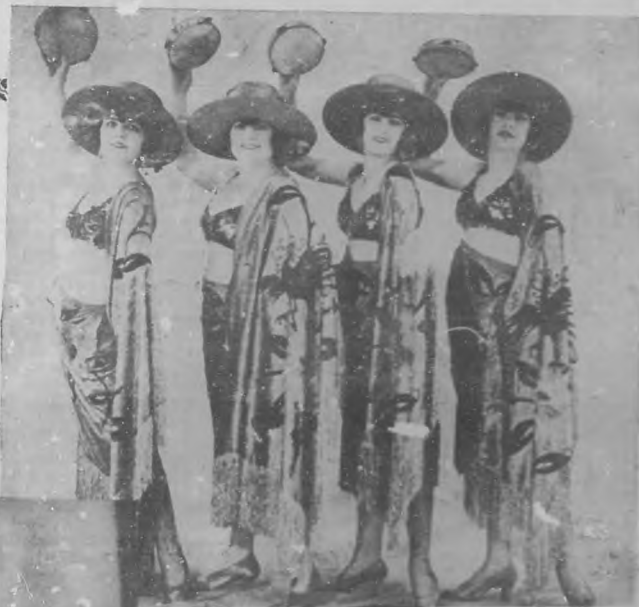
TROUPE SERIESES Acto de sábanas, barras de metal y bailar.

Como faltan ya pocos días para la inauguración de la temporada de ese circo en "Payret" ya son muchas las personas que se están apresurando a separar sus localidades.