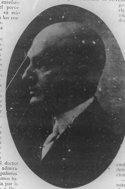
DR. MIGUEL DE CARRION

—Este propósito consiste en obtener de los poderes públicos, el inmediato traslado de las dos Normales de la Habana, del viejo e inútil edificio en que ahora se encuentran a cualquier otro donde sea posible la verdadera educación normalista. (Pasa a la Pág. 50.)