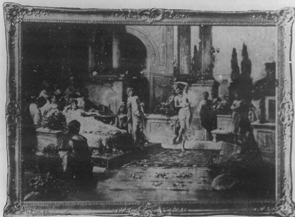
Es, a nuestro juicio, una de las tareas más difíciles para un ama de casa, escoger los objetos de adorno que den una sensación de buen gusto artístico. Teniendo esto en cuenta, nosotras nos proponemos ayudarlas, publicando en esta sección algunos granados de objetos de arte que faciliten, a las que no pueden visitar los grandes establecimientos, la oportunidad de diferenciar los de verdadero mérito de aquellos chabacanos y vulgares que tanto abundan. El grabado que hoy ofrecemos es una fotografía del encantador cuadro "La Corte de Mesalina", el cual puede figurar en el salón más elegante dándole realce, sobre todo si está, como éste que presentamos, en un marco apropiado.