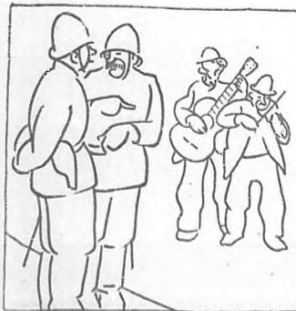
—Mira ti o que inventan os homes pra non traballar.

La ironía, a veces dilacerante y corrosiva, de los dibujos de Castelao, no es una cualidad o una manera exclusivamente suyas, una visión peculiar formada convencionalmente por la fic-